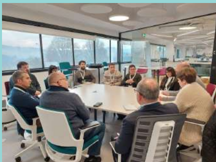
Imagen 1. Taller español

Al principio del proyecto, los socios organizaron sus primeros talleres nacionales en los 5 países europeos del consorcio ( Italia, Portugal, Grecia, España y Eslovaquia ).